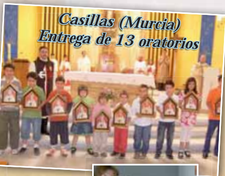
Casillas (Murcia) Entrega de 13 oratorios