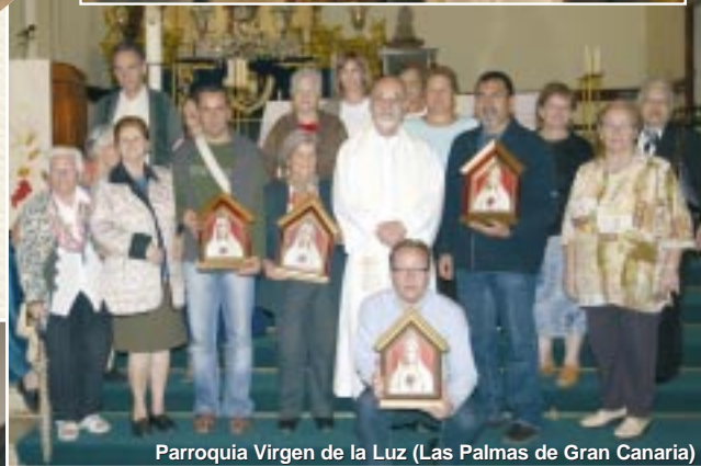
Parroquia Virgen de la Luz (Las Palmas de Gran Canaria)