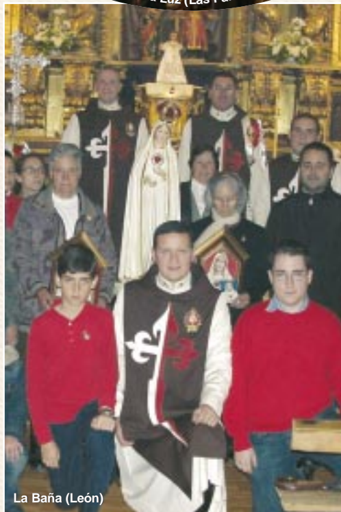
La Baña (León)