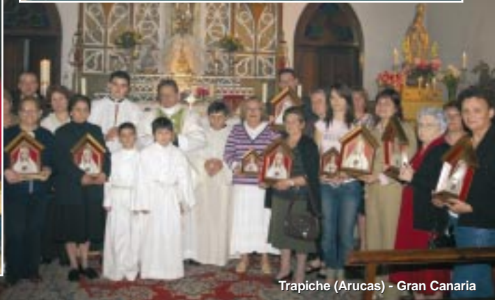
Trapiche (Aruacas) - Gran Canaria