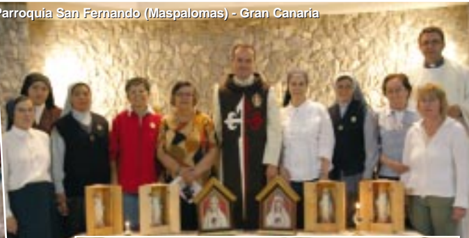
Parroquia San Fernando (Maspalomas) - Gran Canaria