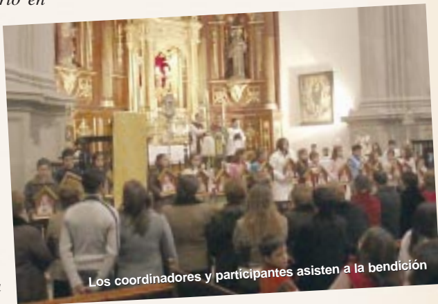
Los coordinadores y participantes asisten a la bendición

(el oratorio) por primera vez, todos los días rezan el rosario en familia por la noche. También varios resaltaron que sentían cómo, además del bien que hace el oratorio allí a donde va, a quien más les estaba ayudando era a ellos mismos. Posteriormente, el Párroco habló sobre la necesidad de tener una vida de piedad muy bien llevada para ser realmente apóstoles y evangelizadores de las familias que les han sido encomendadas. «Ustedes son, como las raíces de la Parroquia, que no se ven, pero si ellas no son fuertes y se alimentan, el árbol no crece ni da fruto».