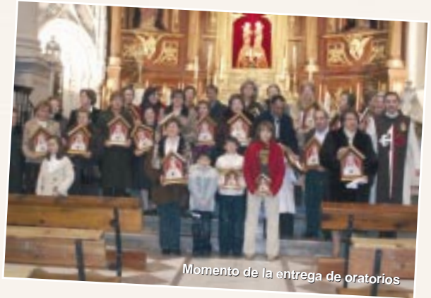
Momento de la entrega de oratorios