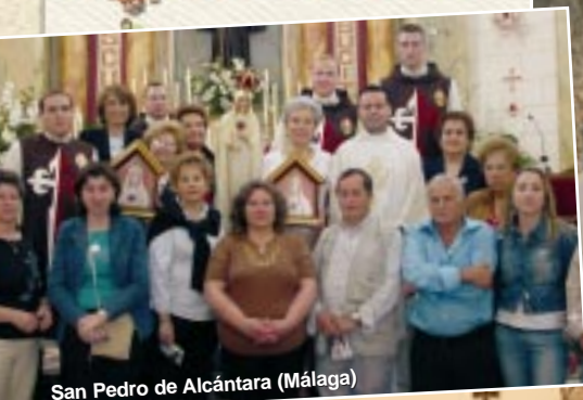
San Pedro de Alcántara (Málaga)