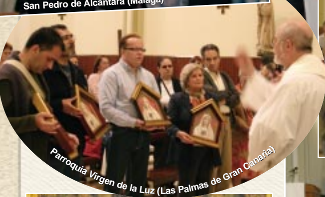
Parroquia Virgen de la Luz (Las Palmas de Gran Canaria)