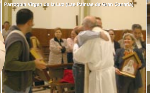
Parroquia Virgen de la Luz (Las Palmas de Gran Canaria)