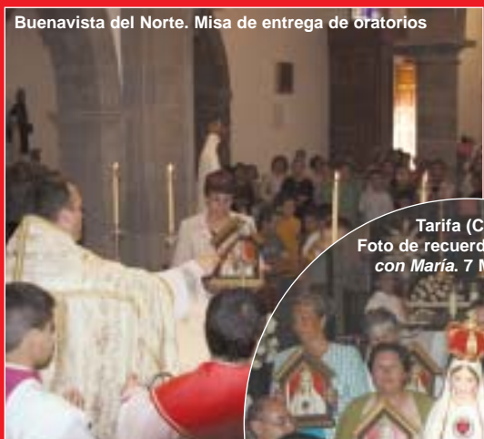
Buenavista del Norte. Misa de entrega de oratorios