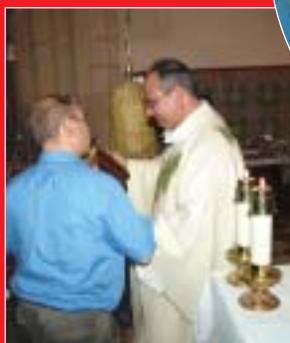
Tarifa. Seis oratorios fueron entregados al final de una jornada memorable.