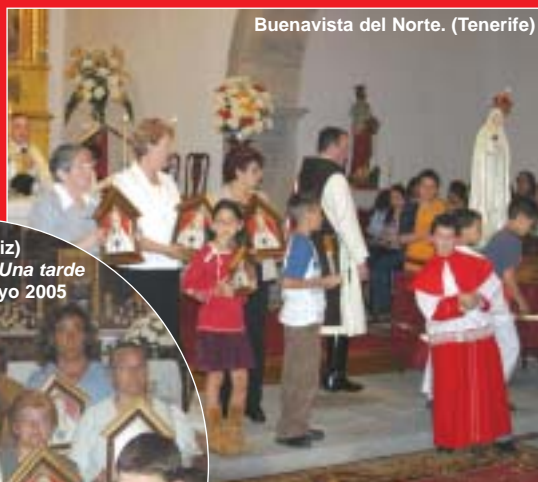
Buenavista del Norte. (Tenerife)