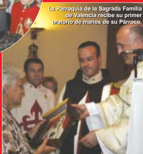
La Parroquia de la Sagrada Familia de Valencia recibe su primer oratorio de manos de su Párroco.