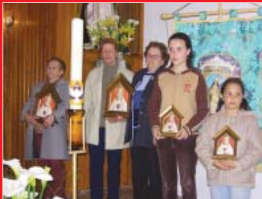
Las Portelas (Tenerife). Nuevos oratorio para niños y adultos