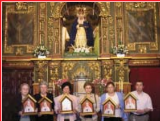
Baena ya tiene cincuenta oratorios